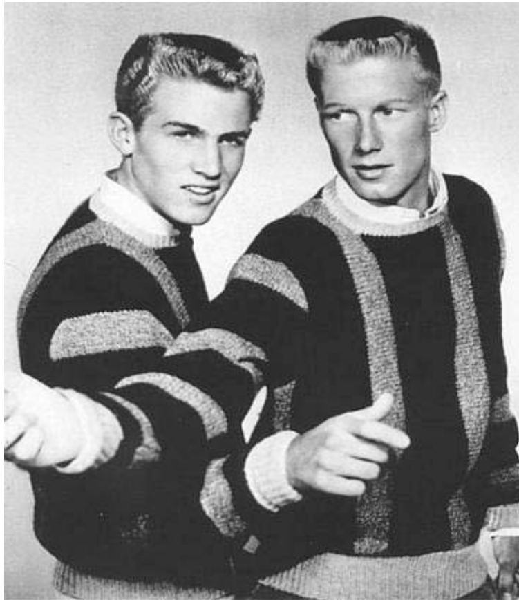
Jan & Dean